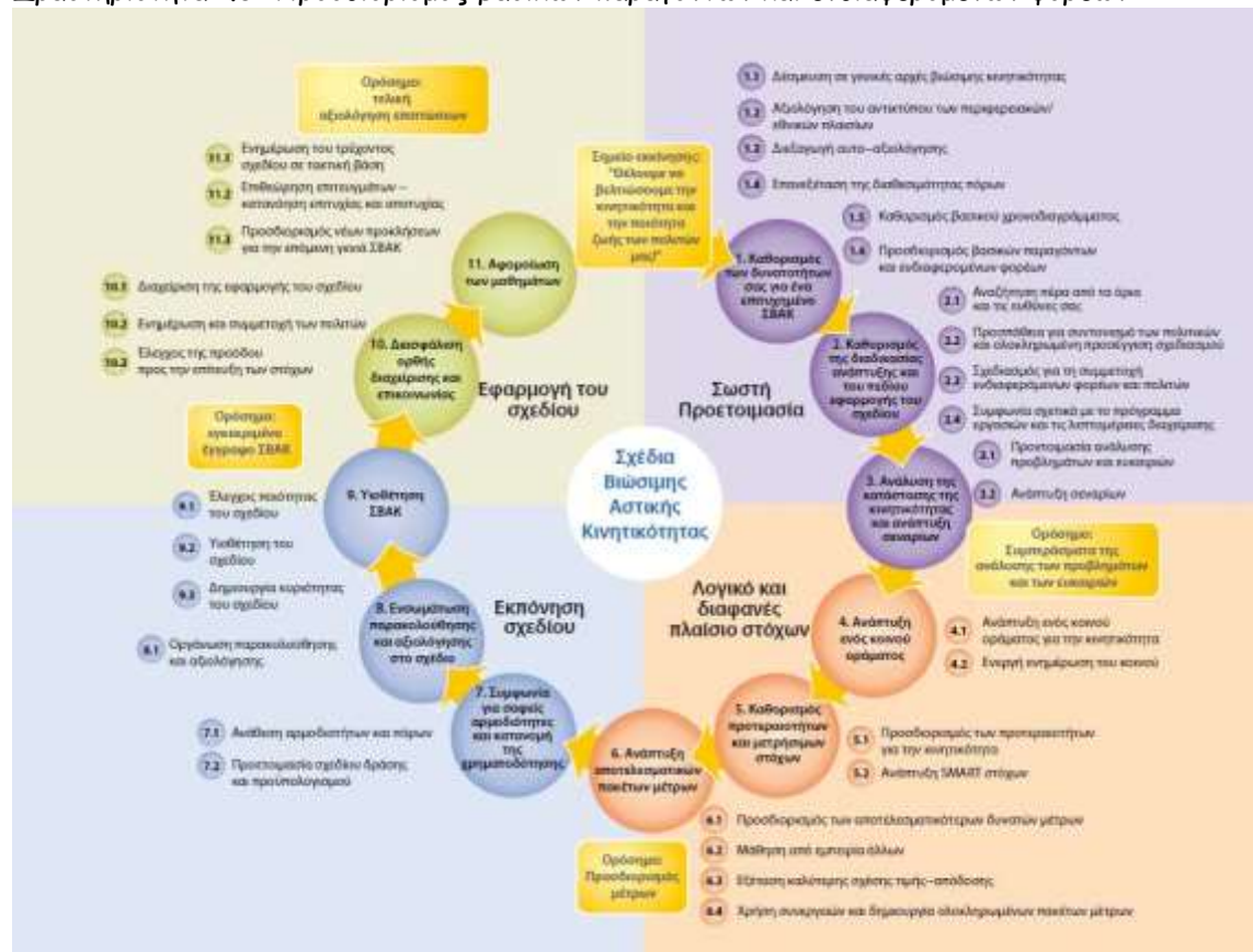
Σχήμα 1. Ο «κύκλος» του ΣΒΑΚ.

Δραστηριότητα 1.6: Προσδιορισμός βασικών παραγόντων και ενδιαφερομένων φορέων